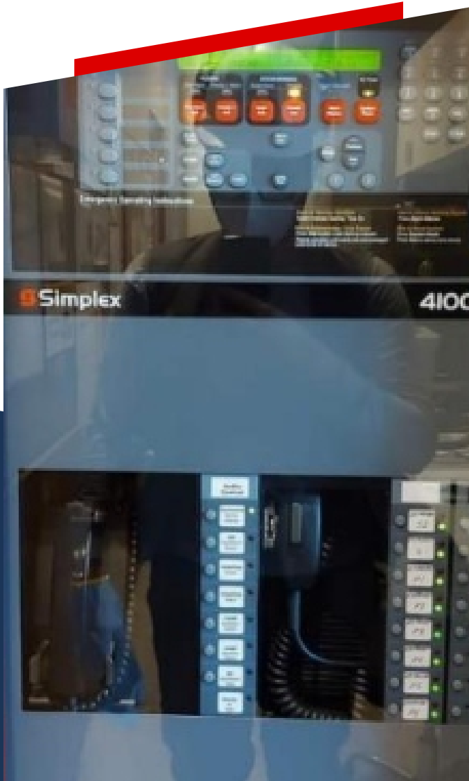
DETECCION Y ALARMA CONTRA INCENDIO

Implementación de sistemas de detección y alarma contra incendio.