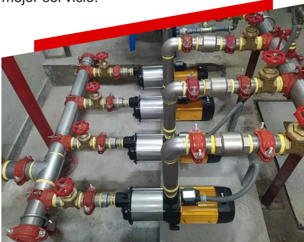
BOMBAS DE PRESION CONSTANTE

Instalación de todo tipo de bombas, brindando un mejor costo, menor tiempo y mejor servicio.