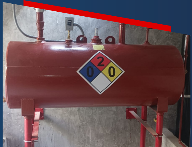
BOMBAS CONTRA INCENDIO