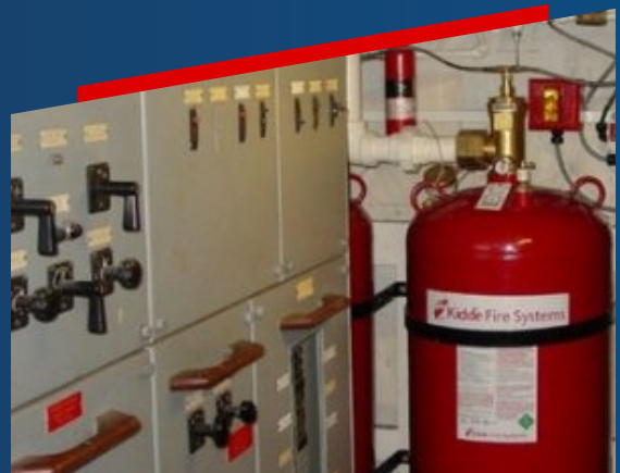
SISTEMA ANALOGO DIRECCIONABLE