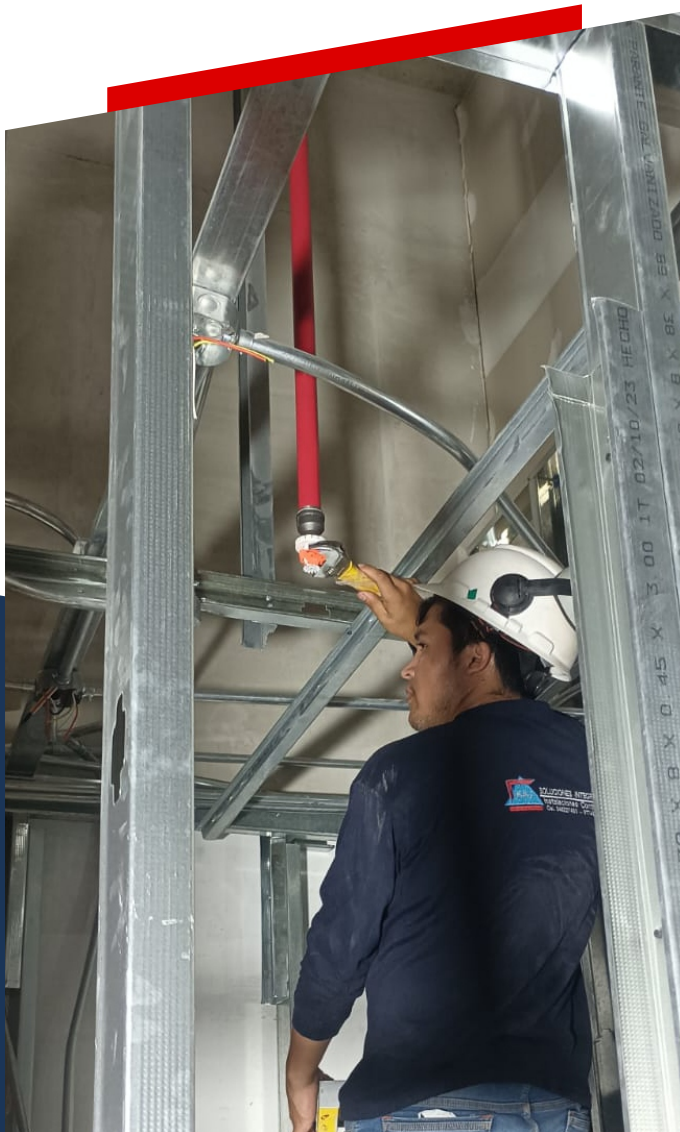
SISTEMA DE AGUA CONTRA INCENDIO

Instalación de sistemas de redes contra incendio.