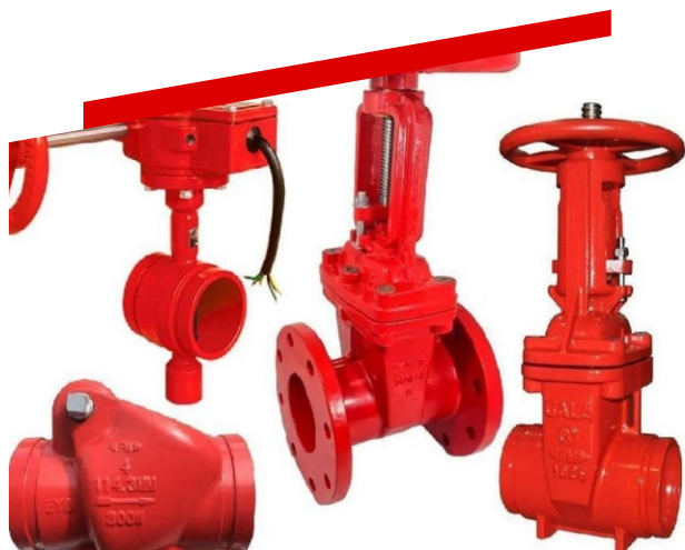
SUMINISTRO DE MATERIALES

Suministro de materiales para redes contra incendio.