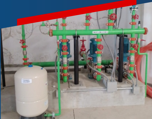
BOMBAS DE PRESION CONSTANTE