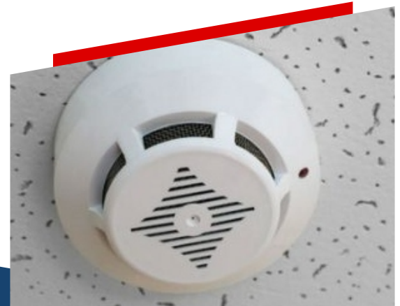
SISTEMA CONVENCIONAL DIRECCIONABLE