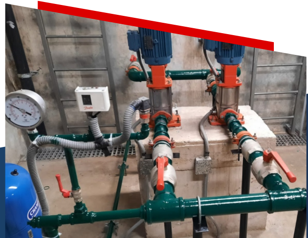
BOMBAS CONTRA INCENDIO