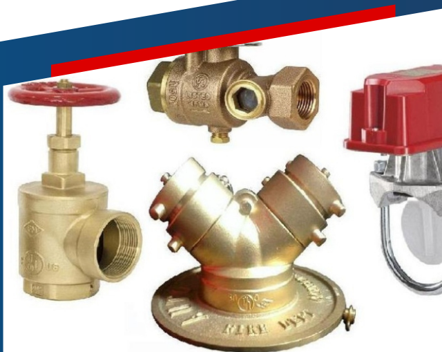
SUMINISTRO DE ACCESORIOS