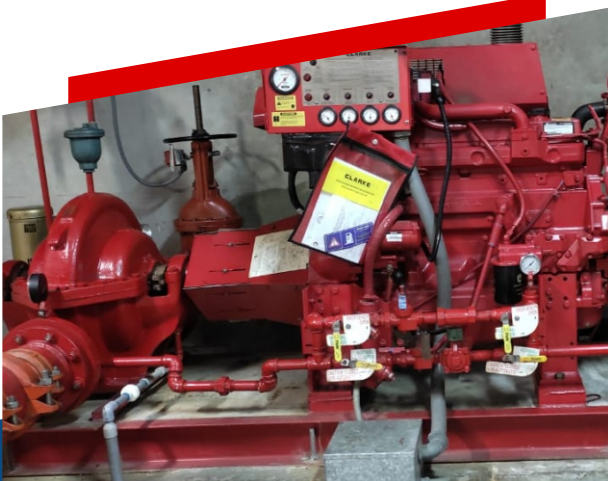
BOMBAS CONTRA INCENDIO