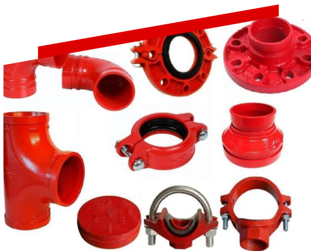
SUMINISTRO DE MATERIALES