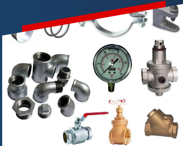
SUMINISTRO DE ACCESORIOS